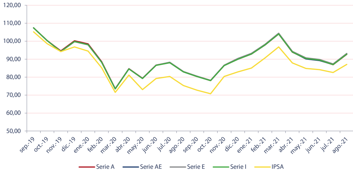
Ilustración 3: Variación del valor cuota (base 100)

su benchmark IPSA, en el mismo periodo, alcanzó un promedio mensual, también negativo, de 0,3%. En la Ilustración 3 se puede observar la evolución del valor cuota en los últimos 24 meses, mientras que en la Tabla 3 se muestra una tabla resumen de la variación del valor cuota presentada por el fondo.